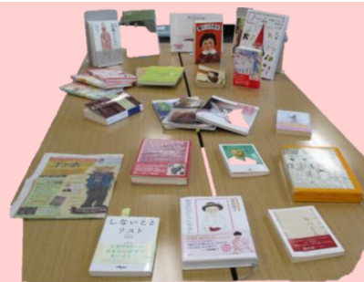
昨年度の参加者のおすすめ本