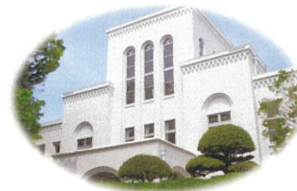
サークル活動発表