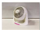
▲サーキュレーター