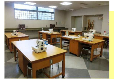
和洋裁室 編み物、七宝焼、刺繍、和裁、洋裁、 手工芸などに使用できます。