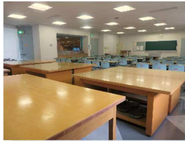
第1学習室 陶芸、華道、絵画、彫刻、工芸など さまざまな学習に使用できます。 ★…窓あり。開閉・換気可能。