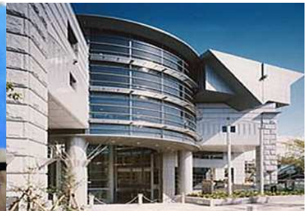
滝野川文化センター

文化センターは、みなさんの学習と交流・文化創造の 広場です。サークル・グループ学習・文化活動の場と してご利用いただくとともに、各種講座・イベントを 開催してみなさんの生涯学習を応援しています。