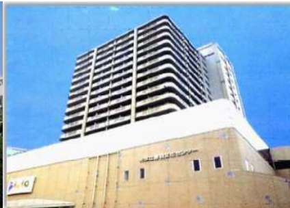
赤羽文化センター