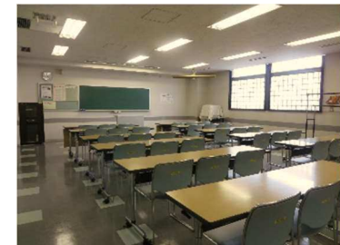
第2・第3学習室 絵画、書道、パソコンなどさまざま な学習に使用できます。