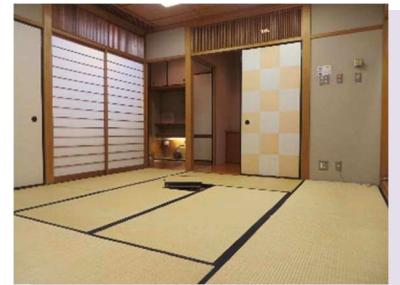
第1・第2和室 茶道、着付けなどに使用できます。