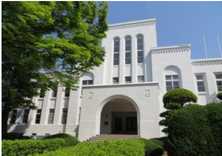
中央公園文化センター