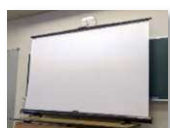
▲移動式スクリーン