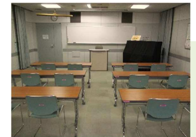
視聴覚室 コース、合奏、映像上映などに 使用できます。 ★…窓あり。開閉・換気可能。

※初めて使用する方は事前にお問い合わせください。使用条件や注意事項を説明します。