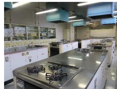
料理室 さまざまな料理の実習、栄養などの 講義に使用できます。