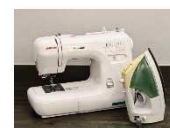
▲ミシン・アイロン