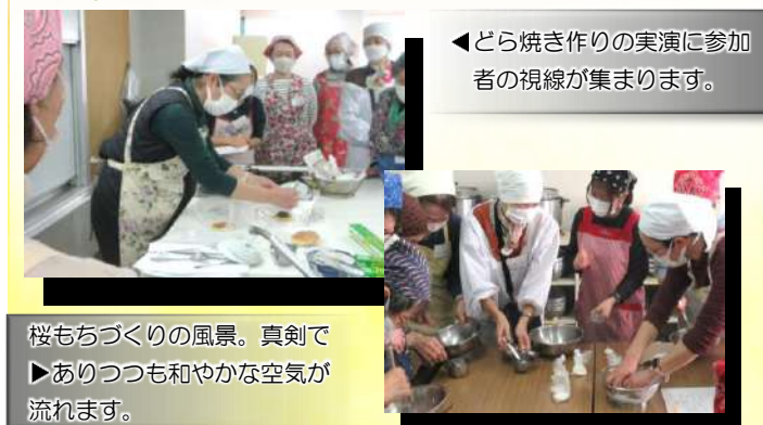
◀どら焼き作りの実演に参加者の視線が集まります。