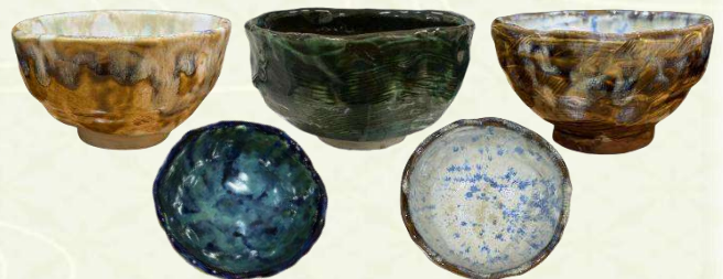
▲完成した抹茶茶碗。内側の模様にもこだわりました。

茶道体験では、和室での作法やお辞儀の仕方について説明を受けた後、茶碗の扱い方など基本の所作を一つひとつ丁寧に学びました。初めての茶道体験にやや緊張した面持ちで臨みながらも、静かな空間の中、手作りの茶碗で抹茶をいただく時間は、陶芸から茶道へとつながる学びを締めくくるひとときとなりました。