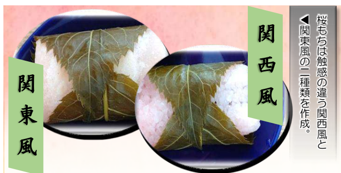
◀桜もちは触感の違いで関東風と関西風の二種類を作成。