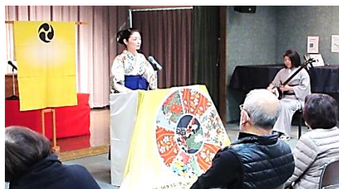
▲三味線は太棹津軽三味線