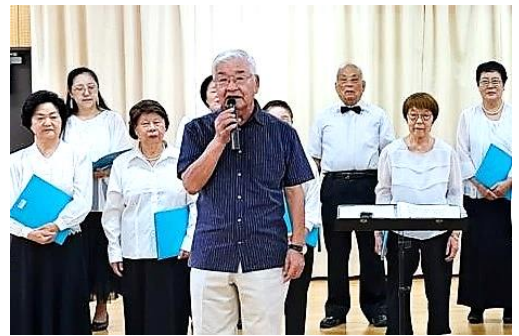
▲2023年9月 中央公園文化センター祭

「歌声喫茶」も皆様のおかげで開催50回を超え、歌った曲の数は450曲以上、延べ演奏回数は1560曲以上にもなりました。毎回、大きな声で楽しそうに歌ってくださる皆さんの顔を拝見すると、歌を続けていて本当に良かったと思っています。また、歌声喫茶から派生した講座の卒業生で発足した「コーラスそよかぜ」も設立から13年たち、団員も少しずつ入れ替わってはいますが、当初からの団員が今でも元気に歌い続けています。年齢も同様に重ねてきてはいますが、月2回練習場に通い声を出すことで、皆さん元気に過ごされているようです。