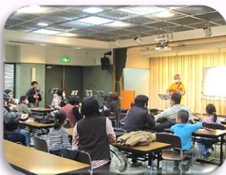
▲オハナサンウクレレ教室（ウクレレ）

2月25日（日）「第38回赤羽文化センター子どもひろば」を開催しました。ボランティアのみなさんに協力をいただき、16プログラムを実施し、297名の子どもたちが参加しました。