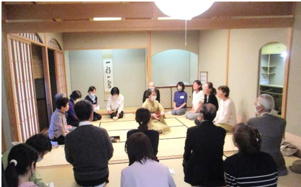
▲1回目は表千家の基本を学びました。

参加理由として「以前から茶道に興味があったが、習い事として始めるのは尻込みしていた。でも、3回の講座であれば気軽に学べそうだと感じた」という方が多くいらっしゃいました。