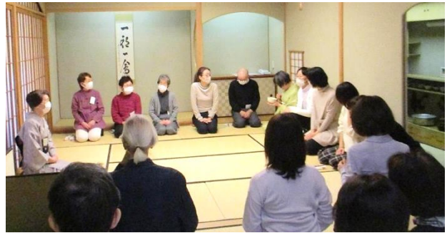
▲3回目は亭主側と客側を体験しました。