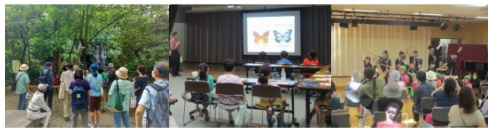
北区立文化センター指定管理者 (株)旺栄

文化センターは、みなさんの学習と交流・文化創造の広場です。サークル・グループ学習・文化活動の場としてご利用いただくとともに、各種講座・イベントを開催してみなさんの生涯学習を応援しています。