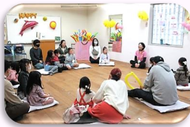
▲EQ(一休)スマイル(笑いヨガ)