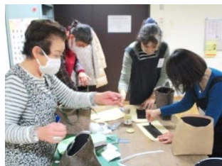
▲ボンドで底板を貼ります。