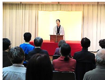
◀ 講談も浪曲も初めてという方も参加

最後の講談「吃の又平」は、登場人物が生き生きと描かれ、情景がくっきりと浮かびました。講談と浪曲で日本の話芸の醍醐味を堪能しました。