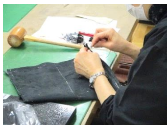
▲皮手縫い用の針が通るほどの穴を開けるのはなかなか力があるようです。