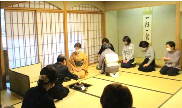
▲2回目はお茶の頂き方などを体験しました。

講師お二人の指導は、ユーモアを交えながら分かりやすく、皆さん熱心に取り組んでいました。