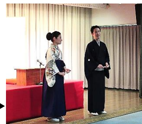
楽しいトークもたっぷり▶