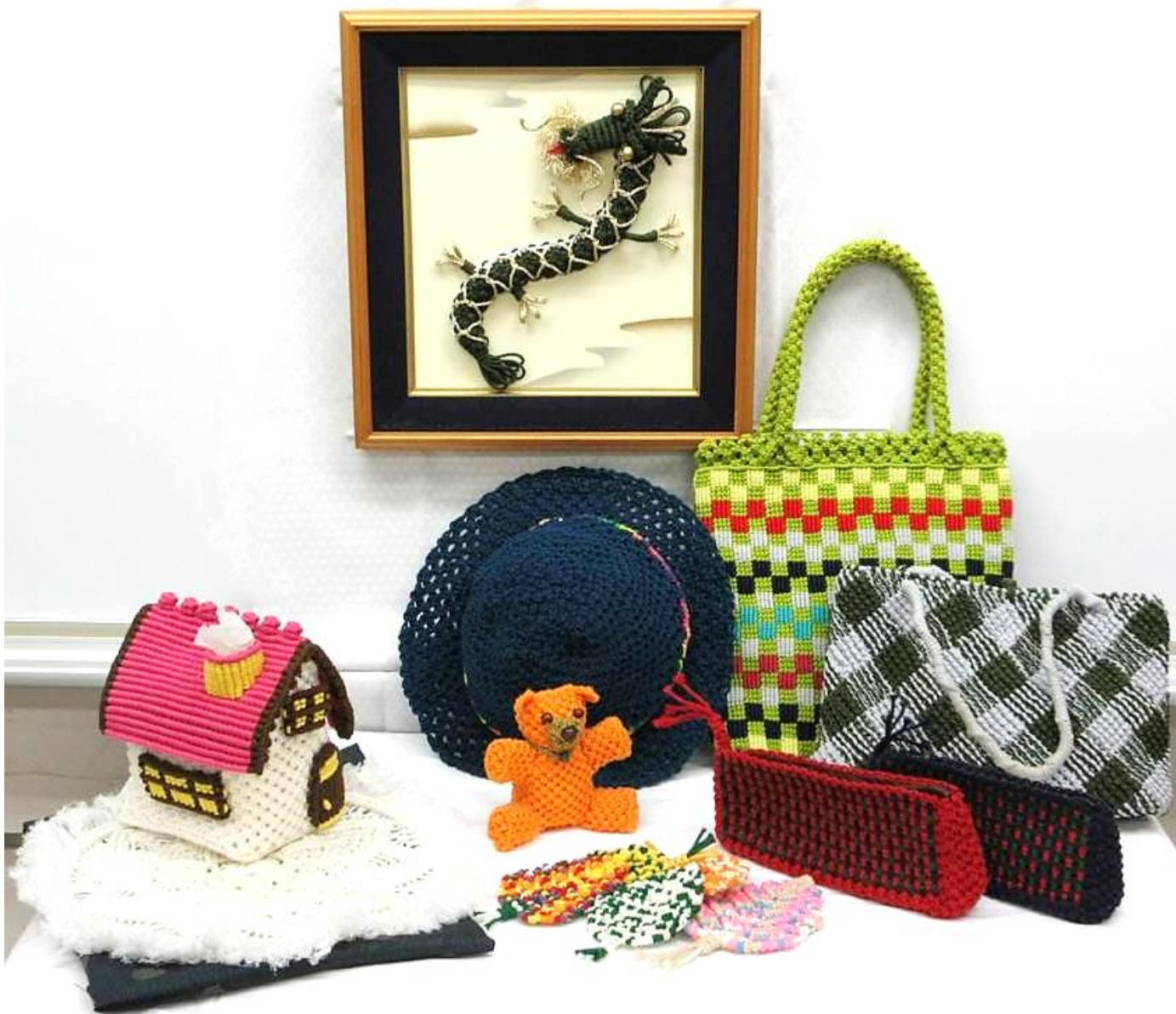
表紙 社会教育関係団体『マクラメの会』

2024年3月18日発行 発行者：北区立文化センター 指定管理者：株式会社 旺栄