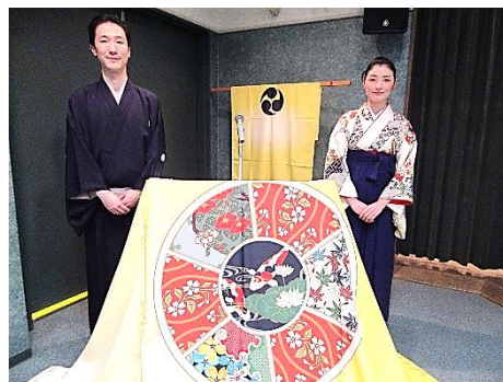
▲師匠のお客様に作って頂いた美しいテーブルかけ