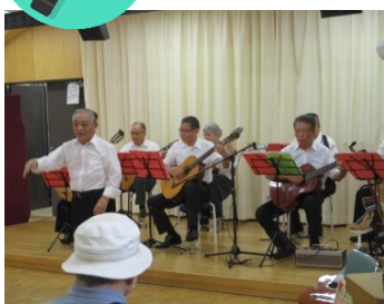
▲紅葉ギター同好会(9月10日)