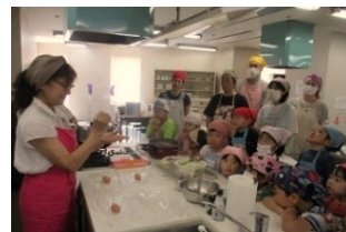
▲お肉を8等分して、細長く丸めて、ラップの上でコロコロ転がし