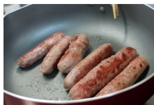
▲焦げ目がつくまで炒めて出来上がり！