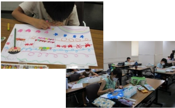
▲のびのび自由に色を塗り重ねます。