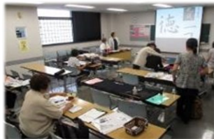
▲なごみ書道会（書道）