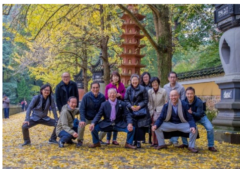
ねいはし ▲中国寧波市天童寺 師と仲間たち

合気道は学生時代に知り、そこで生涯の師と仰ぐ師範との出会いがありました。国内はもとより海外でも人気があり、師範の欧州等遠征先の稽古に参加し、そこで多くの異国の友人ができました。私にとってかけがえのない財産となっています。