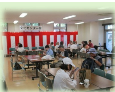
▲軽食・休憩コーナーも復活！