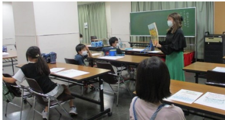
▲ゴッホやピカソなど画家についてのお話を聞きました。