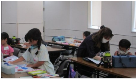
▲講師による丁寧な指導も行われました。