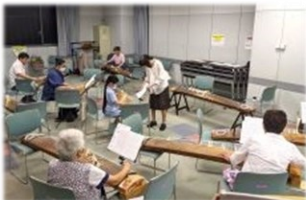
▲生田流箏曲いづみ会（箏曲）

滝野川文化センターで学習活動に取り組むサークルの協力の下、「学びスタート day～学習体験会～」を9月に開催しました。それぞれのサークルの活動日に合わせて学びの1日体験会を実施し、参加者は普段のサークル活動に加わる形で見学・体験しました。絵画や合唱、料理など全16プログラムを開催し、参加者は学習活動やサークル会員との会話を楽しんでいる様子でした。