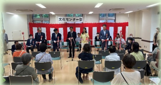
▲オープニングセレモニー テープカットの様子

開催2日間は台風の影響が心配されましたが、一日目に降っていた雨も途中で止み、多くの方が来館されました。展示会場では団体の方と話している姿が見られたり、実演会場では「ブラボー！」という歓声の音が上がりました。今回は実演部門でセンター祭初参加の団体が4団体あり、「是非私たちと一緒に活動しませんか？」という呼びかけが盛んに行われていました。