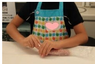
▲キャンデーのように包んで