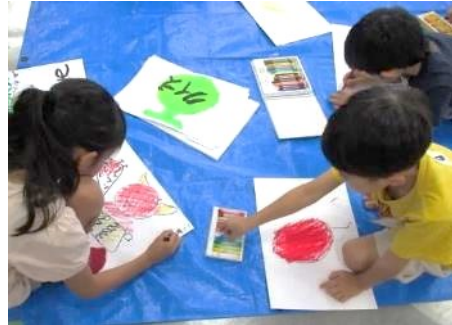
◀ 思い思いの物語を好きな画材を使い紙芝居にしています。

太鼓を叩きながら登場したのは今回の講師である紙芝居師のゴリラせんせい。お祭りのような雰囲気の中、朗々とした語り口調で繰り広げられる口演に参加した子どもたちも興味津々。前のめりになって夢中で聴き入っていました。