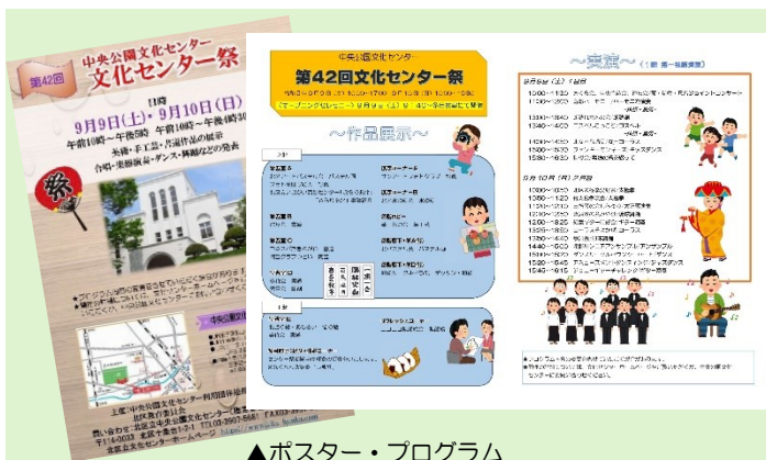
▲ポスター・プログラム

今年で42回目となる中央公園文化センターのセンター祭を、2日間にわたり開催しました！ [9月9日(土) 午前10時～午後5時・10日(日) 午前10時～午後4時30分]