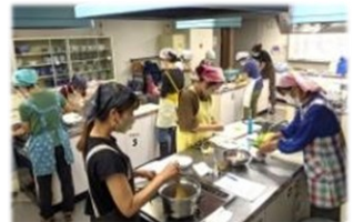
▲滝野川料理クラブ（料理）