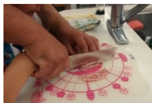
▲ベーコンを細かくみじん切り。材料をボウルに入れてよくまぜます。

皮なしの手作りソーセージで、小さいお子さんも美味しく食べられます。ぜひ、ご家庭で作ってみてください。