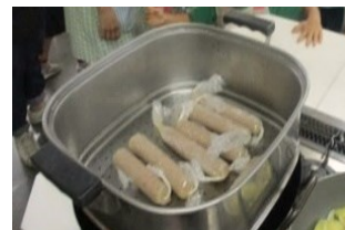
▲蒸し器で15分蒸します。