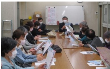
▲十条銀座商店街事務所にてレクチャー