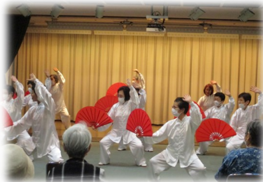
動きにあわせて朱色の扇子が開き 迫力ある音が会場内に響きます。

「赤羽文化ひろば」は赤羽文化センターを利用している団体が、区民の皆さんに気軽に文化に触れていただくために、日頃の学習成果を発表するイベントです。今回は5月に開催された「太極拳」の様子を紹介します。〔5月21日（日）午後1時30分～4時30分〕