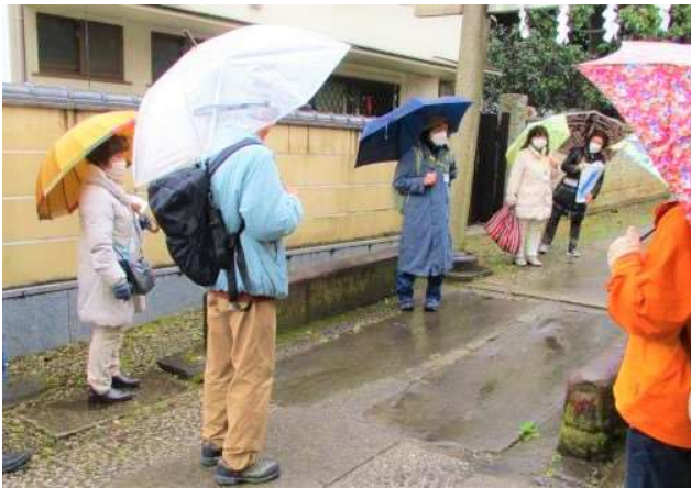
▲田端八幡神社の参道には、移設保存された谷田川の欄干が。

2日間とも雨の中での開催となりましたが、参加者は講師や昔の谷田川の様子を知る地域の方々の話に熱心に耳を傾け、曲がりくねった小道や残された欄干から谷田川が地上を流れていた頃の景色や暮らしを想像し、自分たちの暮らす地域に新たな発見があることを楽しんでいる様子でした。