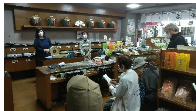
▲各店舗で、お店の歴史などの楽しい説明がありました。